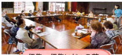
伊集 伊集いじゆの花