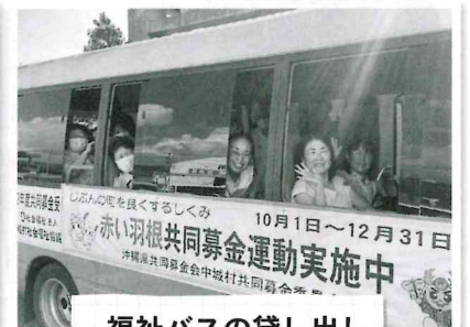
福祉バスの貸し出し