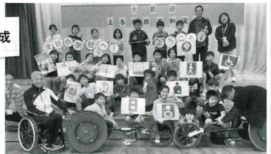
ボランティアの育成