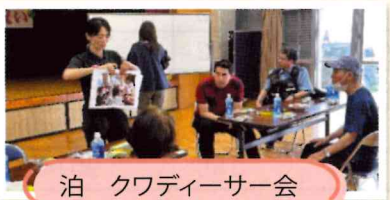
泊 クワディーサー会