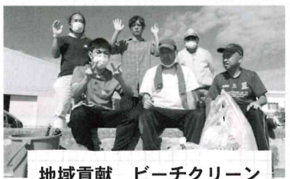
地域貢献 ビーチクリーン