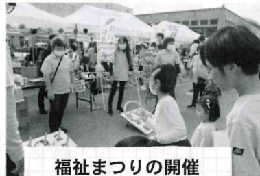
福祉まつりの開催