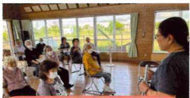
南浜 お達者クラブみなみはま

4/3沖縄本島に津波警報が発令されました。ふれあい事業で多くの高齢者が集まる機会に課題やニーズについて共有しました。