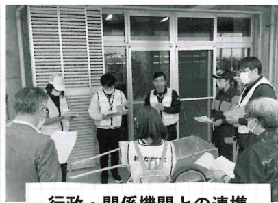
行政・関係機関との連携